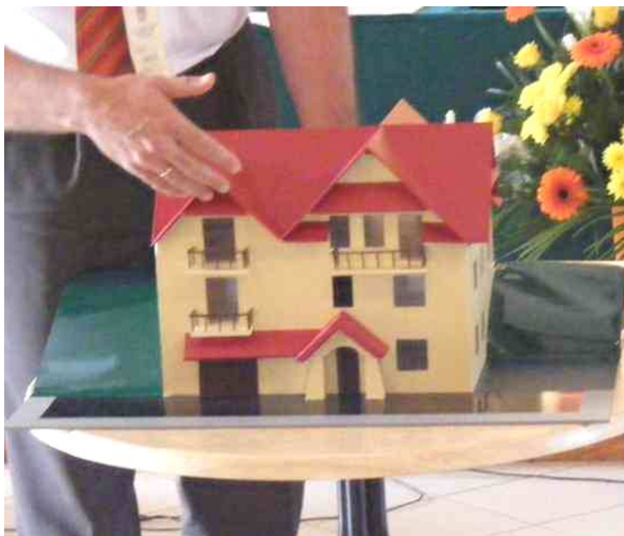
Projekt naszego drugiego, nowego budynku przy ul. Jagiellońskiej 100 w Krościenku

Krąg Przyjaciół powstał w 2010 roku aby - niezależnie od składek przekazywanych z kręgów - zbierać fundusze na potrzeby Centralnego Domu Rekolekcyjnego DK. Jest wiele prac, które podobnie jak w domu można wykonać o własnych siłach. Poważniejsze wymagają zatrudnienia profesjonalnych ekip remontowych, a co za tym idzie - znaczących środków finansowych (...) W ciągu ostatniego roku (IV 2010 - IV 2011) zebraliśmy 13.790 złotych, które zasiliły fundusz remontowy.